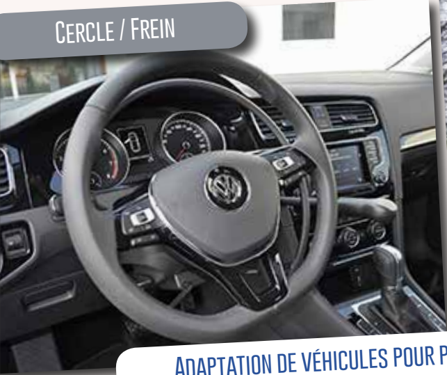
ADAPTATION DE VÉHICULES POUR PERSONNES À MOBILITÉ RÉDUITE