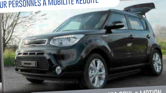
CONDUITE EN FAUTEUIL - KIA SOUL E MOTION